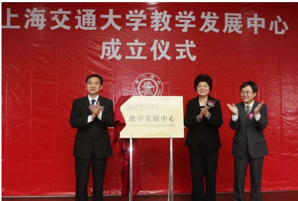
图为教育部高教司司长张大良、上海市教委副主任印杰与上海交通大学党委书记马德秀一起为教学发展中心成立揭牌。

上海交通大学将以教学发展中心的建设为抓手，努力提升教师的教学水平，从而完善创新人才培养体系，提高人才培养质量。