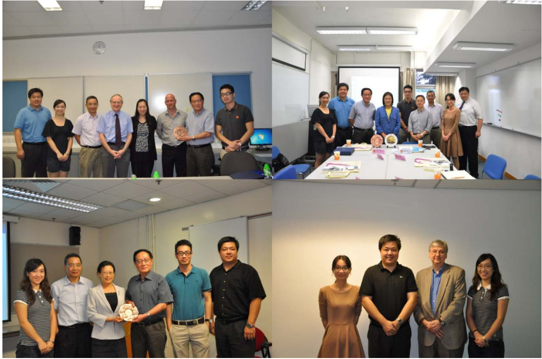
*左上：与香港大学教与学促进中心合影，右上：与香港中文大学学能提升研究中心合影，左下：与香港理工大学教学发展中心合影，右下：与香港科技大学教学促进中心合影