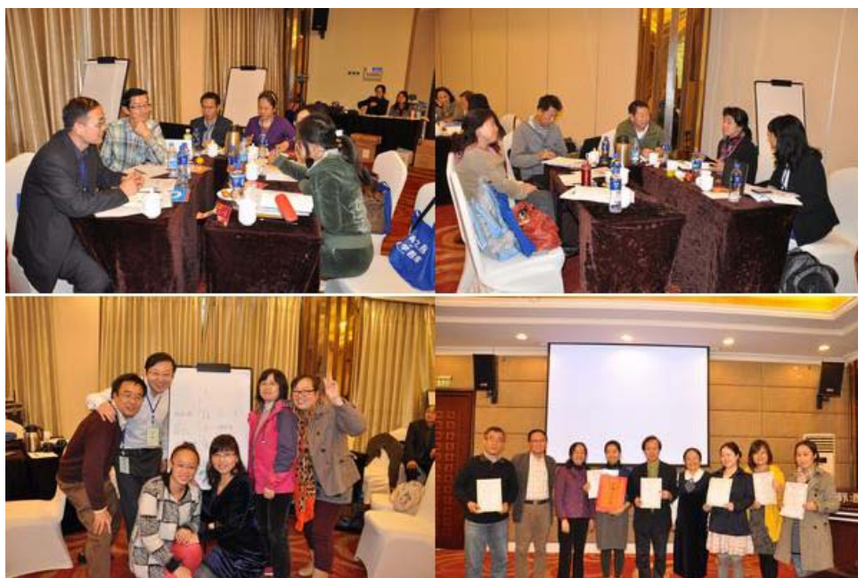
第二期研修班小组合作场景