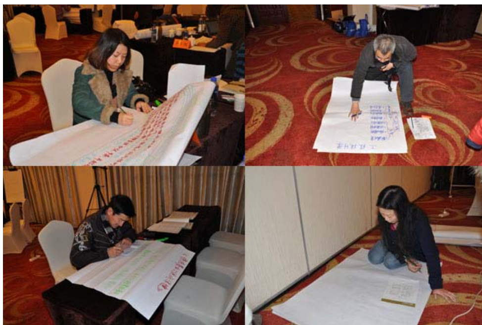
第三期研修班学员制作海报过程