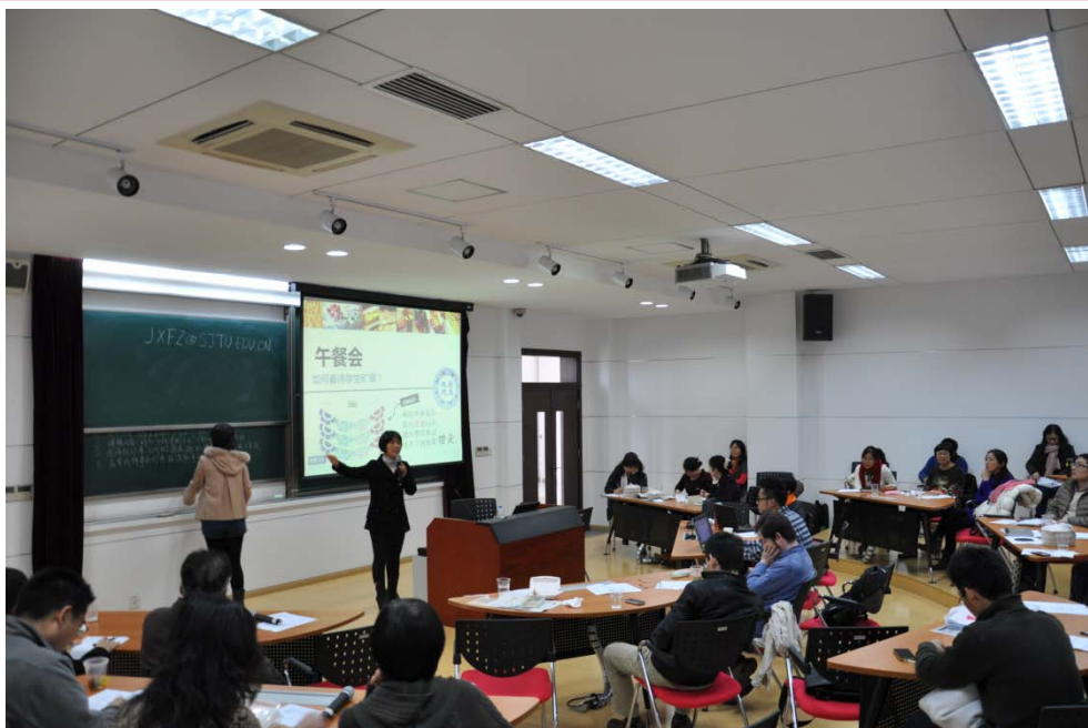
教学发展中心第 11 期午餐会(总第 48 期)《如何看待学生旷课》